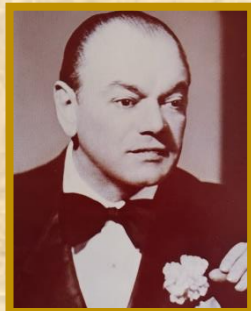
フランシスコ カナロ